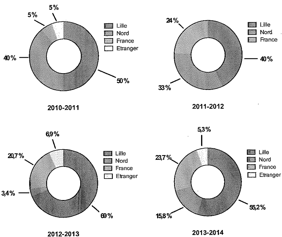
Figure 2 : origine géographique des étudiants entrant en M1