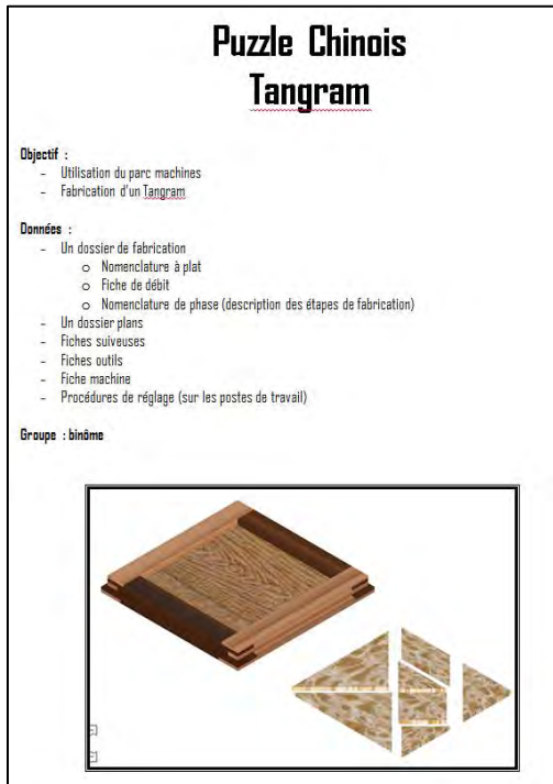
Exemple du Tangram réalisé par les étudiants en binôme

valider des compétences liées à la fabrication et à l'organisation des étapes de production. Les documents supports de travail sont adaptés aux élèves (photos et fonction des machines - détail des étapes d'usinage - fiche machines)